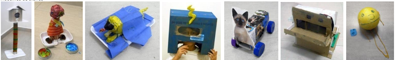
Trabalhos de alunos

Formada em Artes Plásticas pela FAAP. Frequentou diversos ateliês de artistas plásticos. Participou de salões e mostras de arte e trabalhou 12 anos como Editora de Arte. Paralelamente sempre fez pinturas, desenhos e esculturas. Editou e ilustrou 2 livros para crianças e adolescentes editados pela Mackron Books. Há mais de 10 anos dá aulas para crianças e adultos de desenho, escultura em pedra e papel machê. Hoje, continua com as aulas de papel machê, artes e costura e também desenvolve trabalhos em papel machê e faz pinturas em tela.